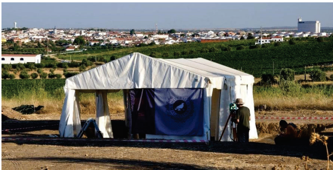
Figura 2. Campaña de la UMA 2010. La localidad de Reguengos de Monsaraz al fondo.

los trabajos de la UMA en Perdigiões, pensamos que el éxito de la empresa que nos ha ocupado durante casi una década se cimentó en tres ejes principales: