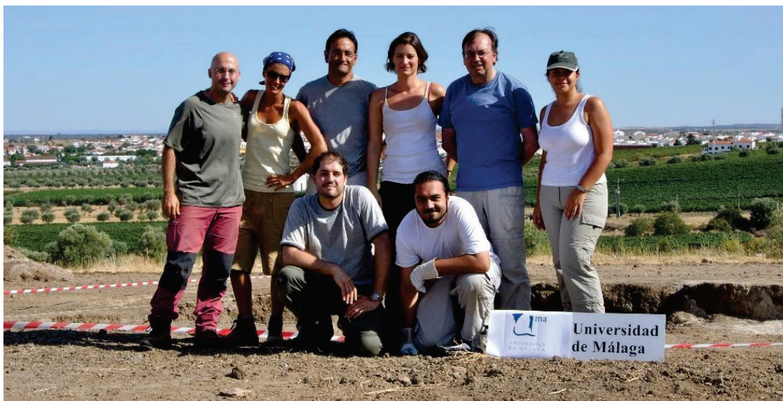
Figura 3. Equipo de la UMA Campaña 2010