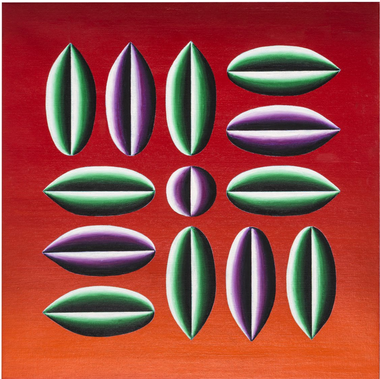
Benito Lozano Flânerie por el viento de poniente Óleo sobre lino 50 x 50 cm 2025