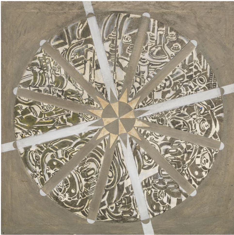
Enrique Queipo Estrella positiva Óleo sobre lienzo 110 x 110 cm 1991