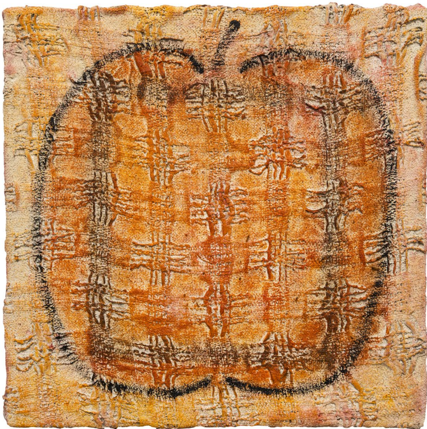
◀ José Melguizo Saturno devorando a su hijo Óleo sobre arpillera 104 x 74 cm 2021