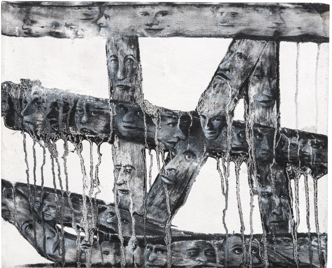
Plácido Romero H.S.1 Óleo sobre lienzo 162 x 114 cm 2024