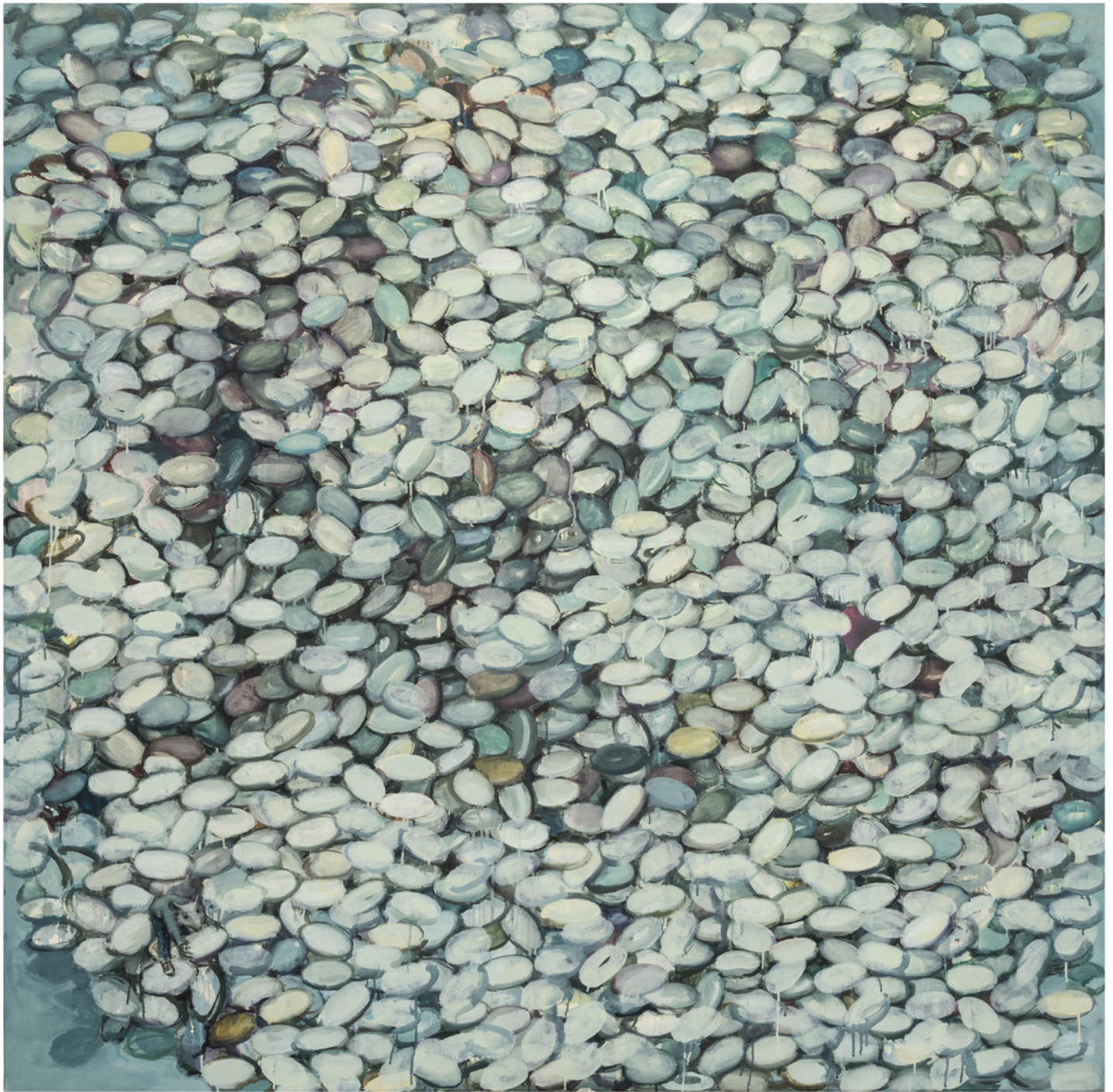
Chema Lumbreras La sombra del pájaro Óleo sobre tela 150 x 150 cm 2008