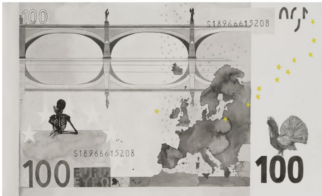
Isabel Garnelo Medidas de austeridad (billete de 100€) Tinta china, acuarela y grafito sobre papel 64 x 120 cm 2013