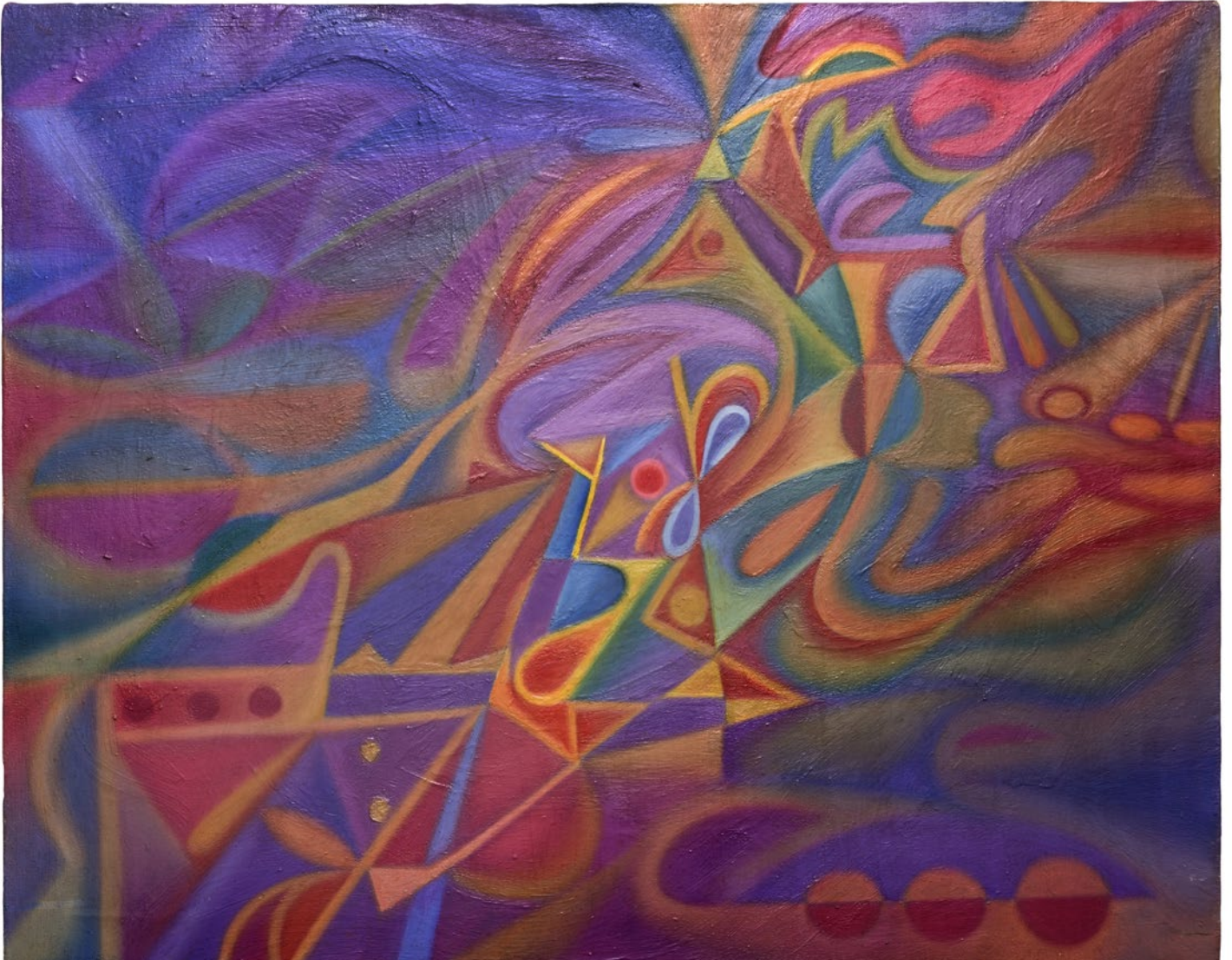
Enrique Queipo Colorista Óleo sobre lienzo 73 x 92 cm 1990