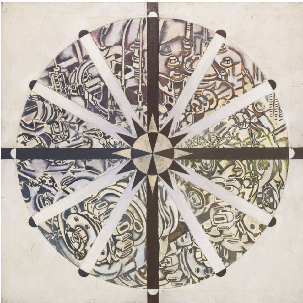
Enrique Queipo Estrella negativa Óleo sobre lienzo 110 x 110 cm 1991