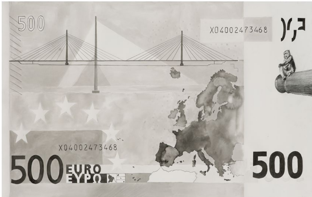
▲ Isabel Garnelo Inversión de perspectiva (billete de 500 €) Tinta china y grafito sobre papel 72 x 130 cm 2013