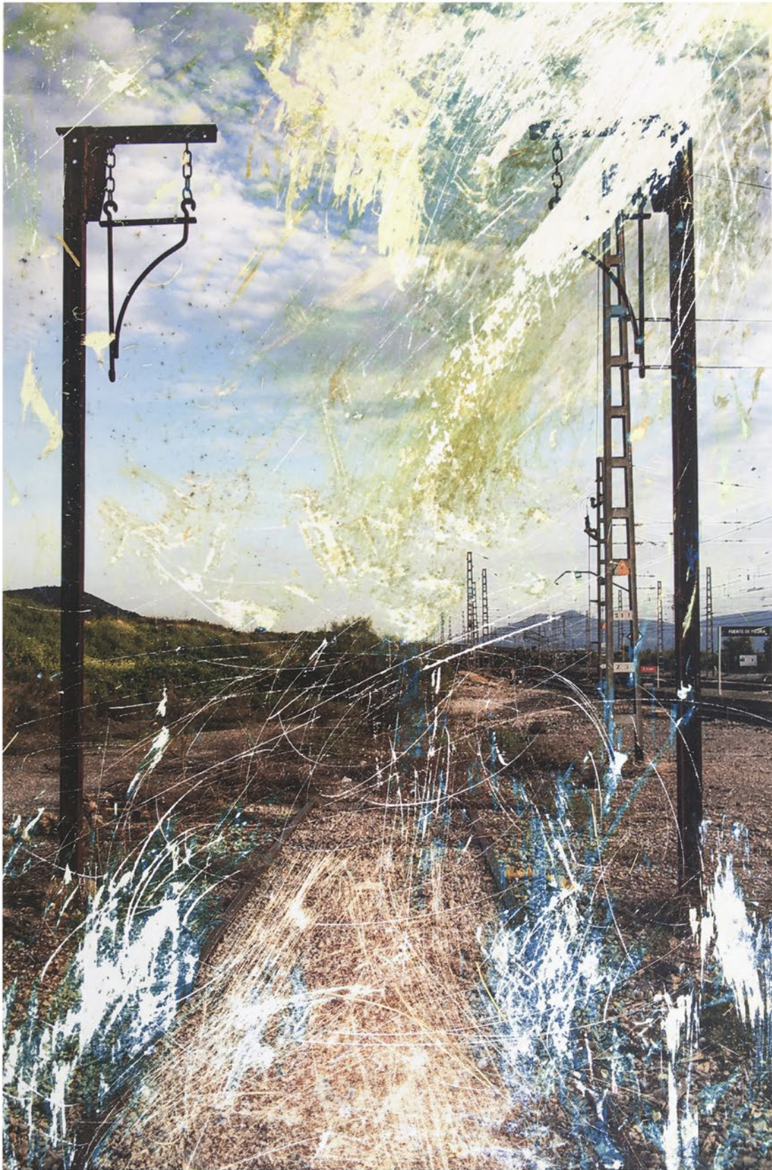
Manuel Criado Ítaca, ida Fotografía color revelado químico Intervención química, rayados y frottage 13 x 18 cm 2025