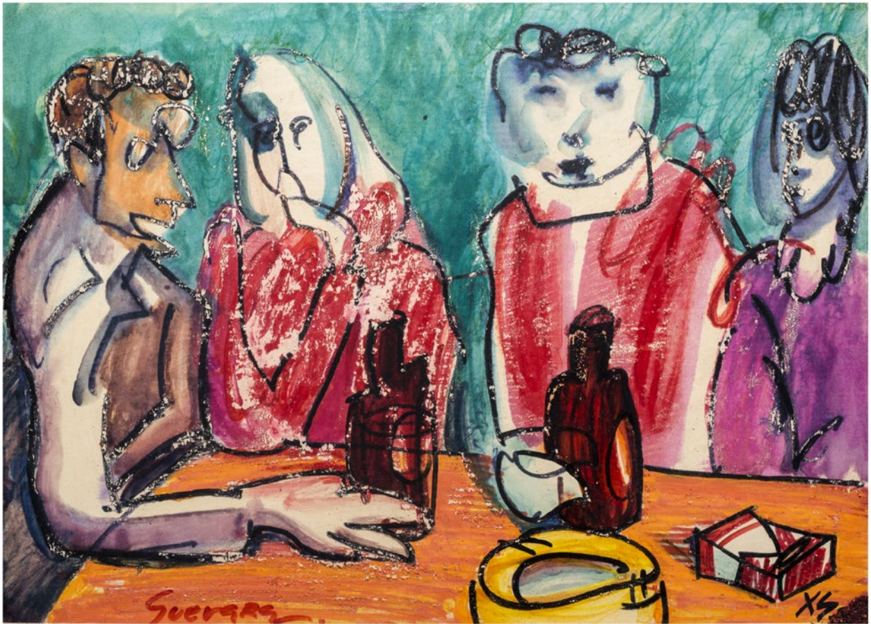
Carlos Guevara Zigamar Tinta china, acuarela y ceras sobre papel 28,5 x 39,5 cm 1998