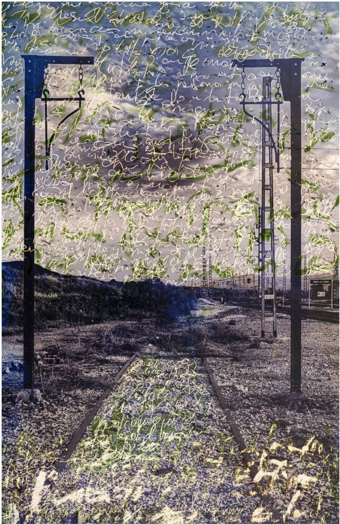
Manuel Criado Itaca, vuelta Fotografía blanco y negro revelado químico Intervención química, rayados y frottage 13 x 18 cm 2025