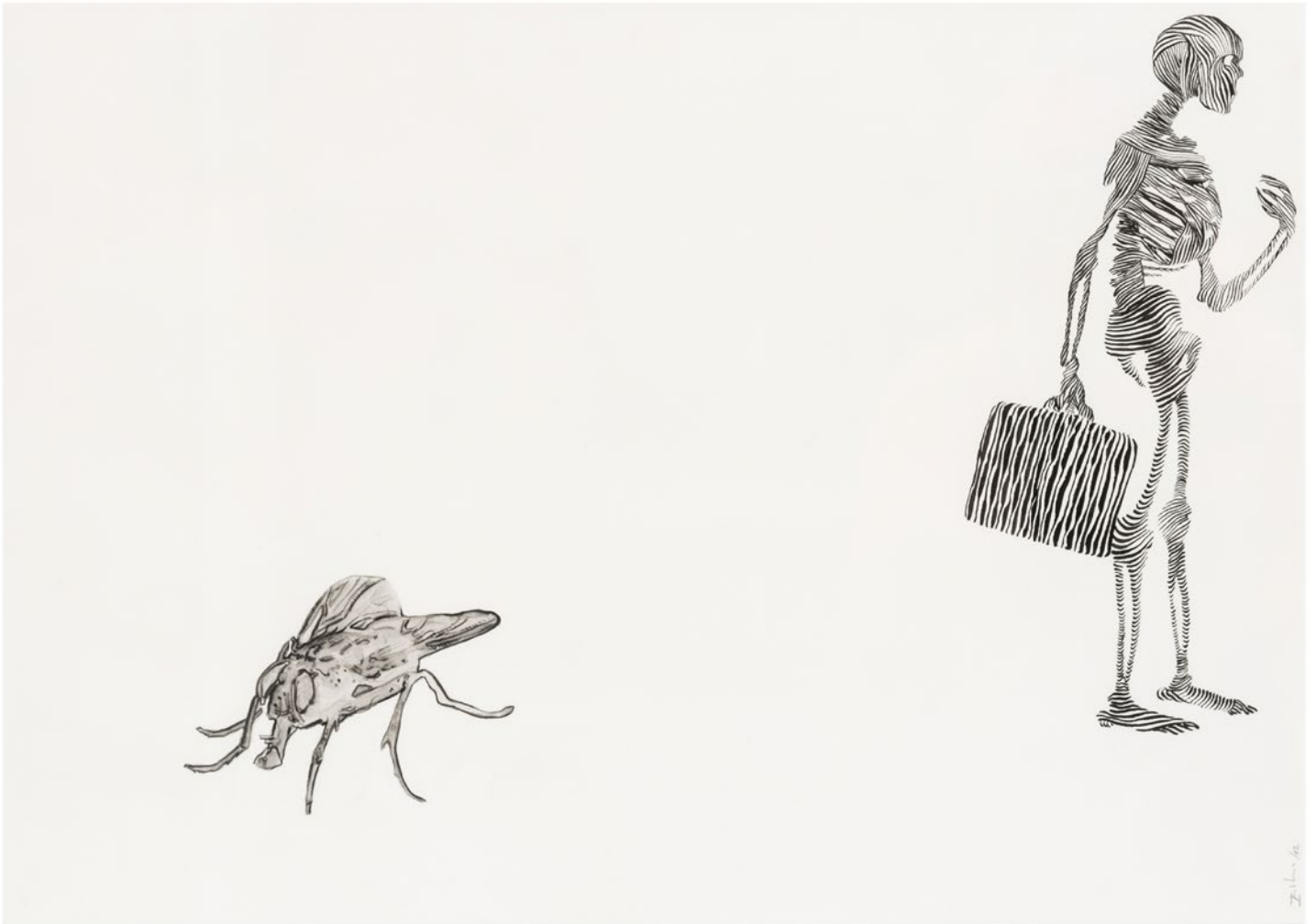
Isabel Garnelo Circulante pasivo y mosca Tinta china sobre papel Arches 100% algodón 300 g 51 x 63 cm 2012