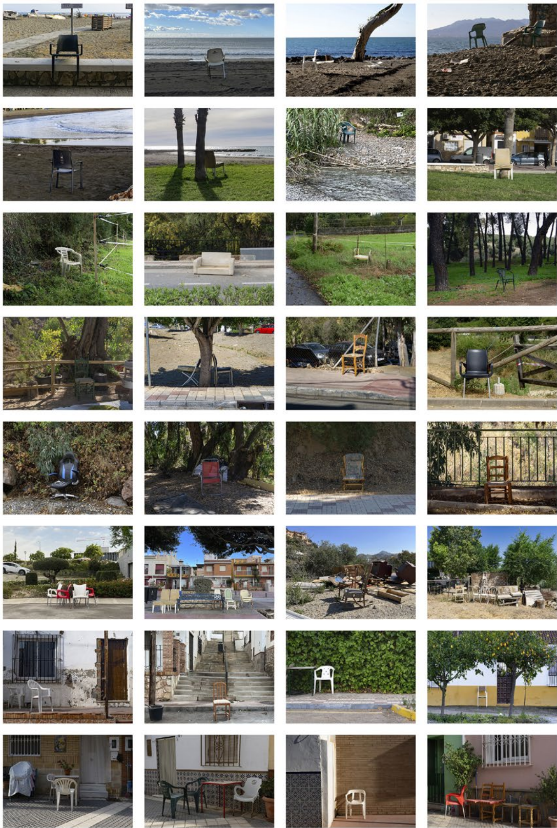
◀ Manuel Criado Silla contenedores Fotocomposición con 28 fotografías 100 x 80 cm 2025