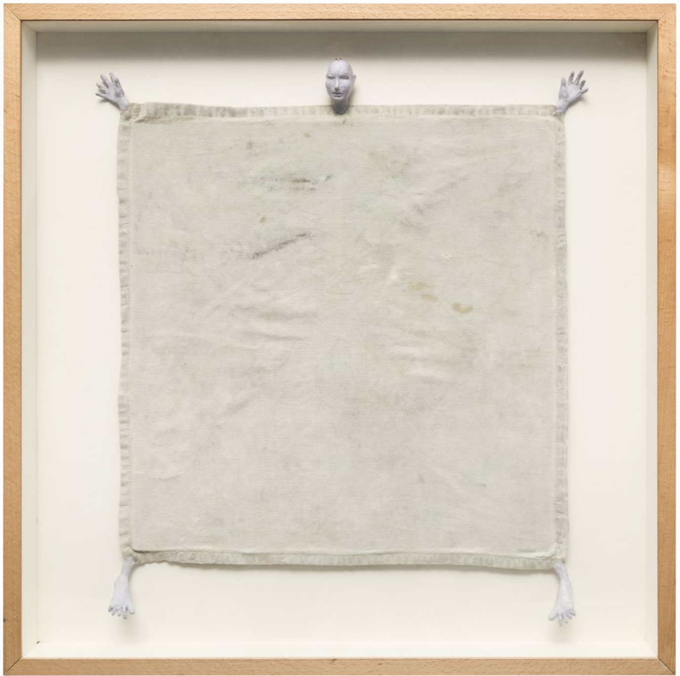
Chema Lumbreras Trapo Técnica- técnica mixta, tela alambre, papel maché, y pintura acrílica 50 x 50 cm 2015