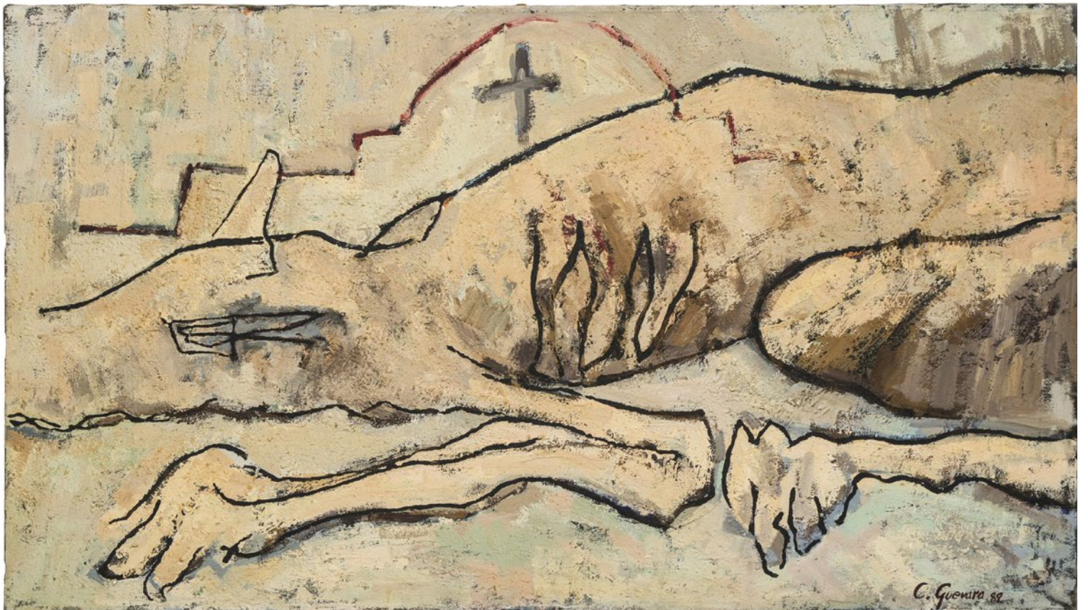
Carlos Guevara S/T. (pero acostado) Óleo, tela 130 x 75 cm 1989