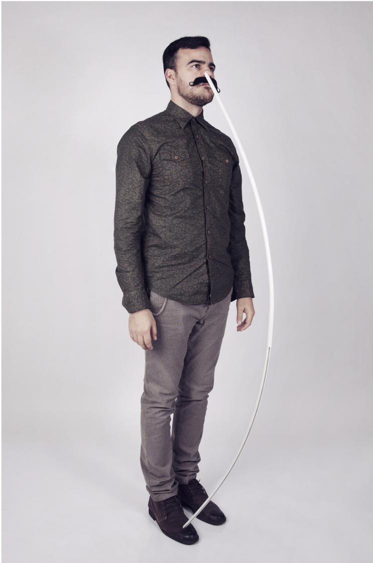
Arturo Comas Calero Autorretrato IV, 2011 Autorretrato V, 2012