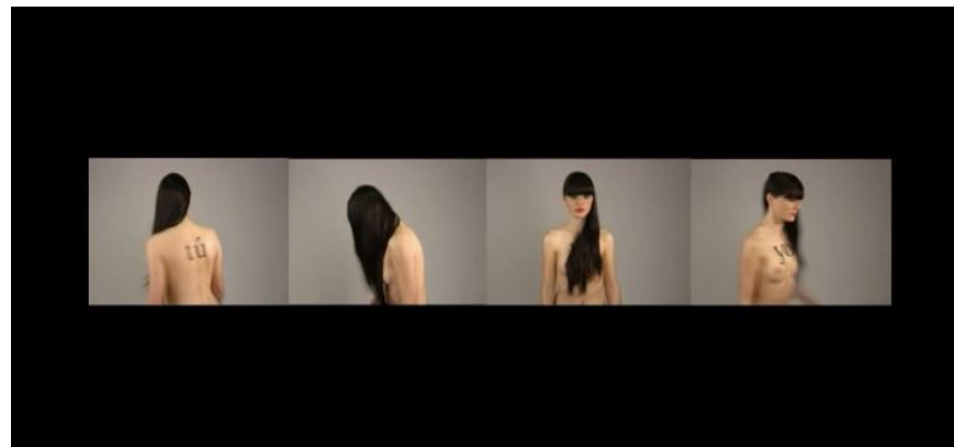
TuYotro Vídeo, 1'25'', 2009

La ambivalencia, la oscuridad, el desconcertante orden, los significantes que encadena, la deconstrucción de los conceptos, son resortes hipnóticos propios de su cálculo estético con el que, a la postre, consigue enmudecernos y situarnos durante un instante delante del espejo.