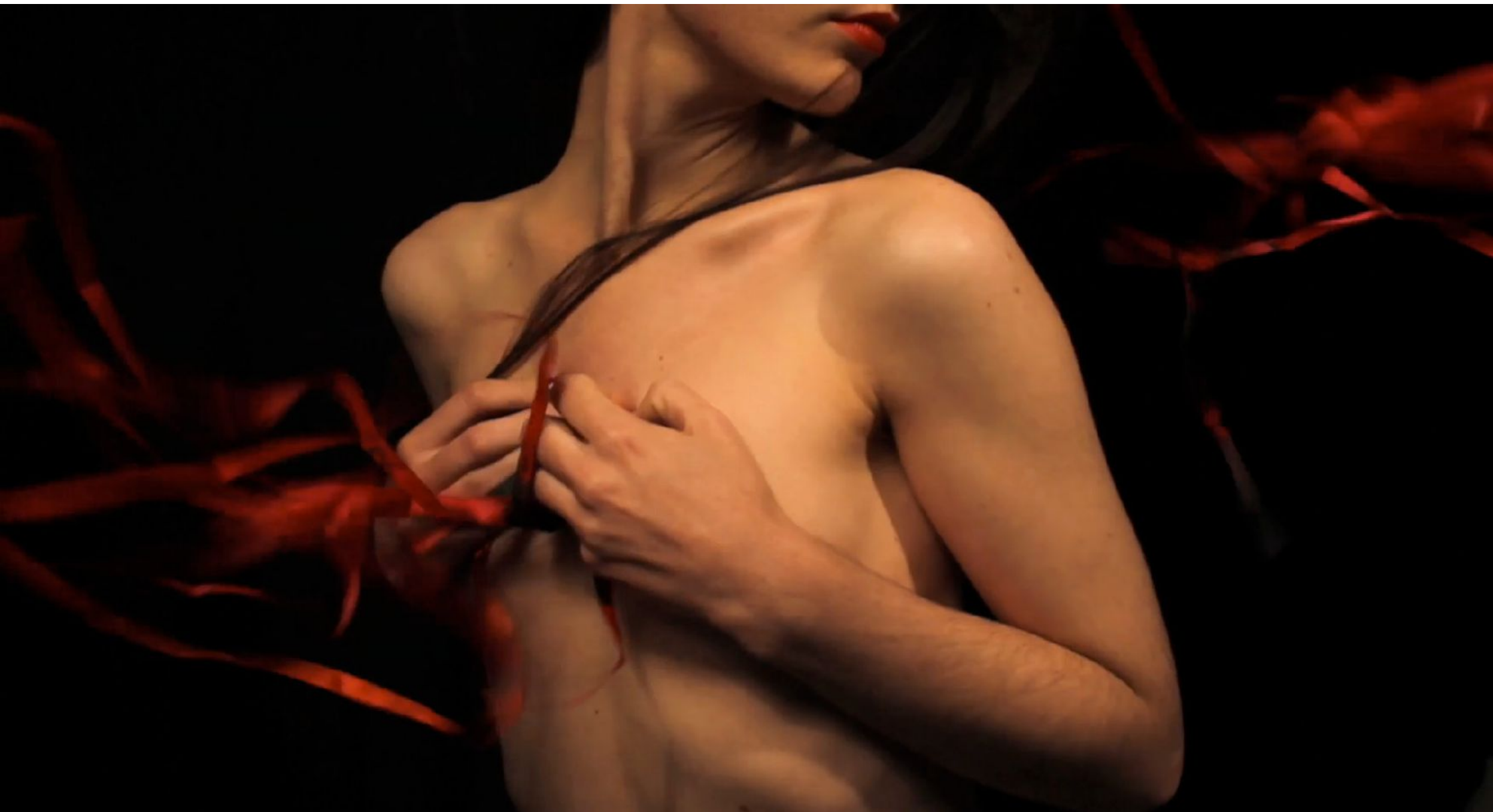
Mi pecho es un bosque de flechas Vídeo, 2'15'', 2014