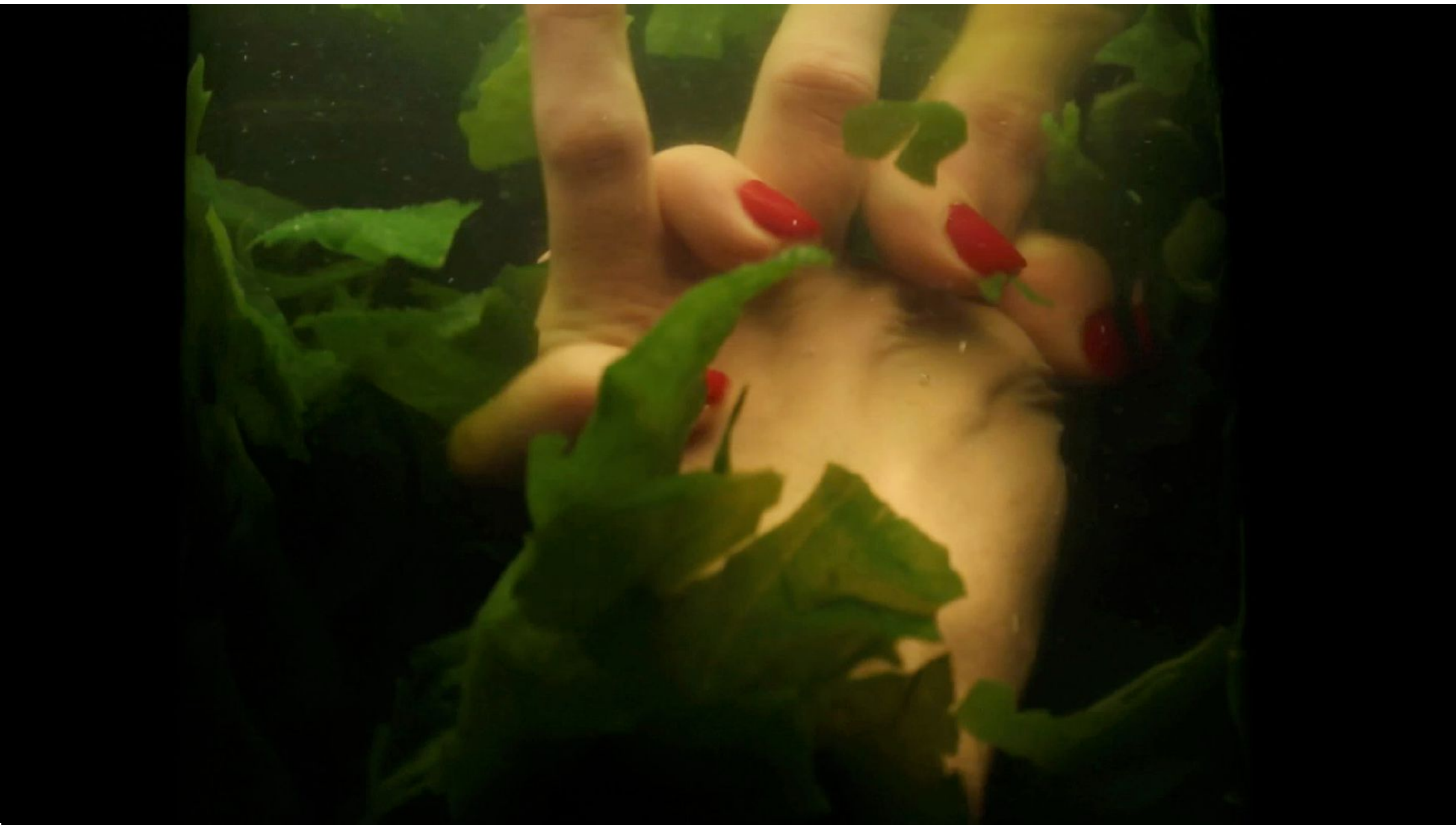
Zurda Vídeo, 3', 2014