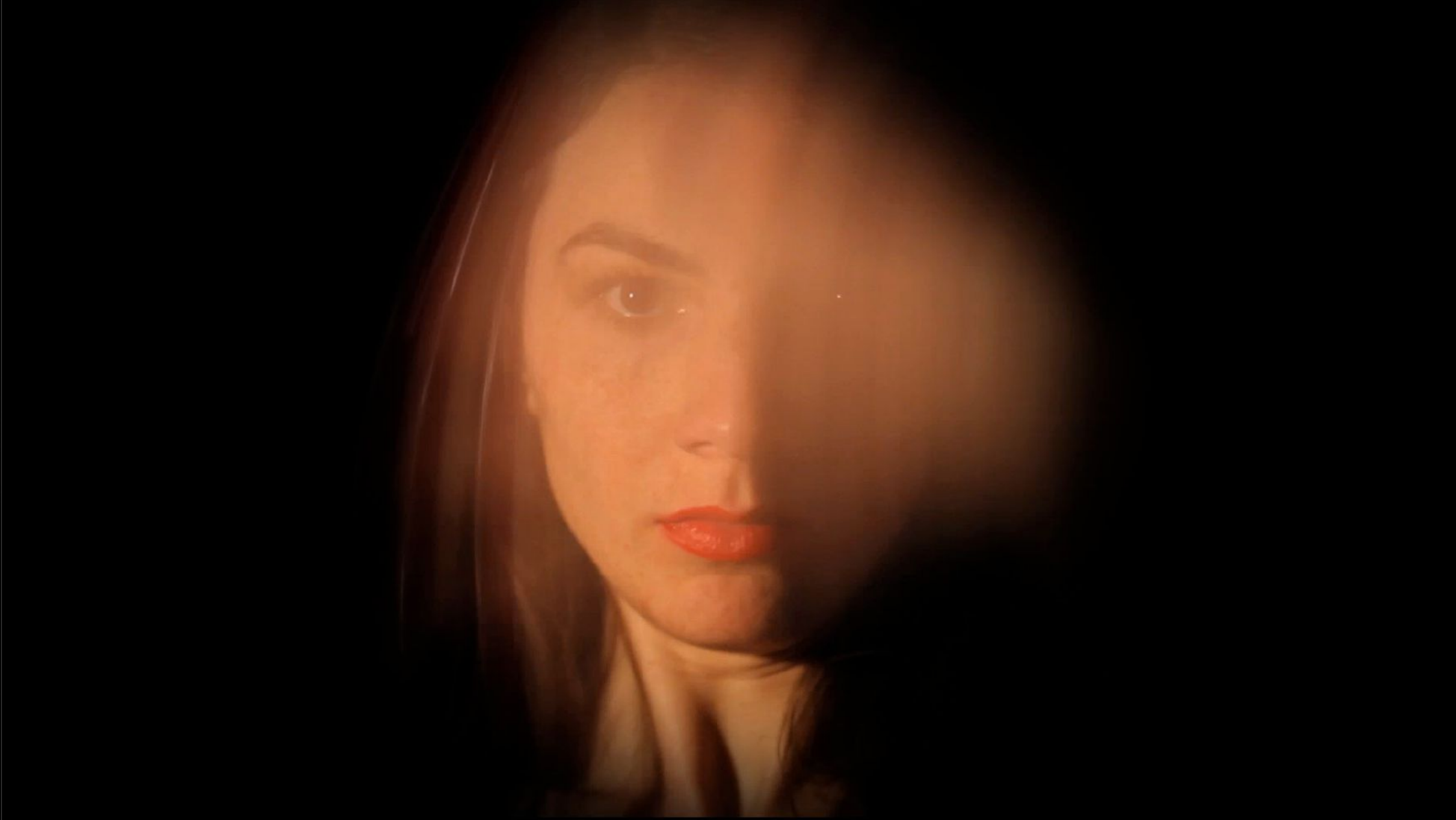
Desaparecer Vídeo, 1', 2014