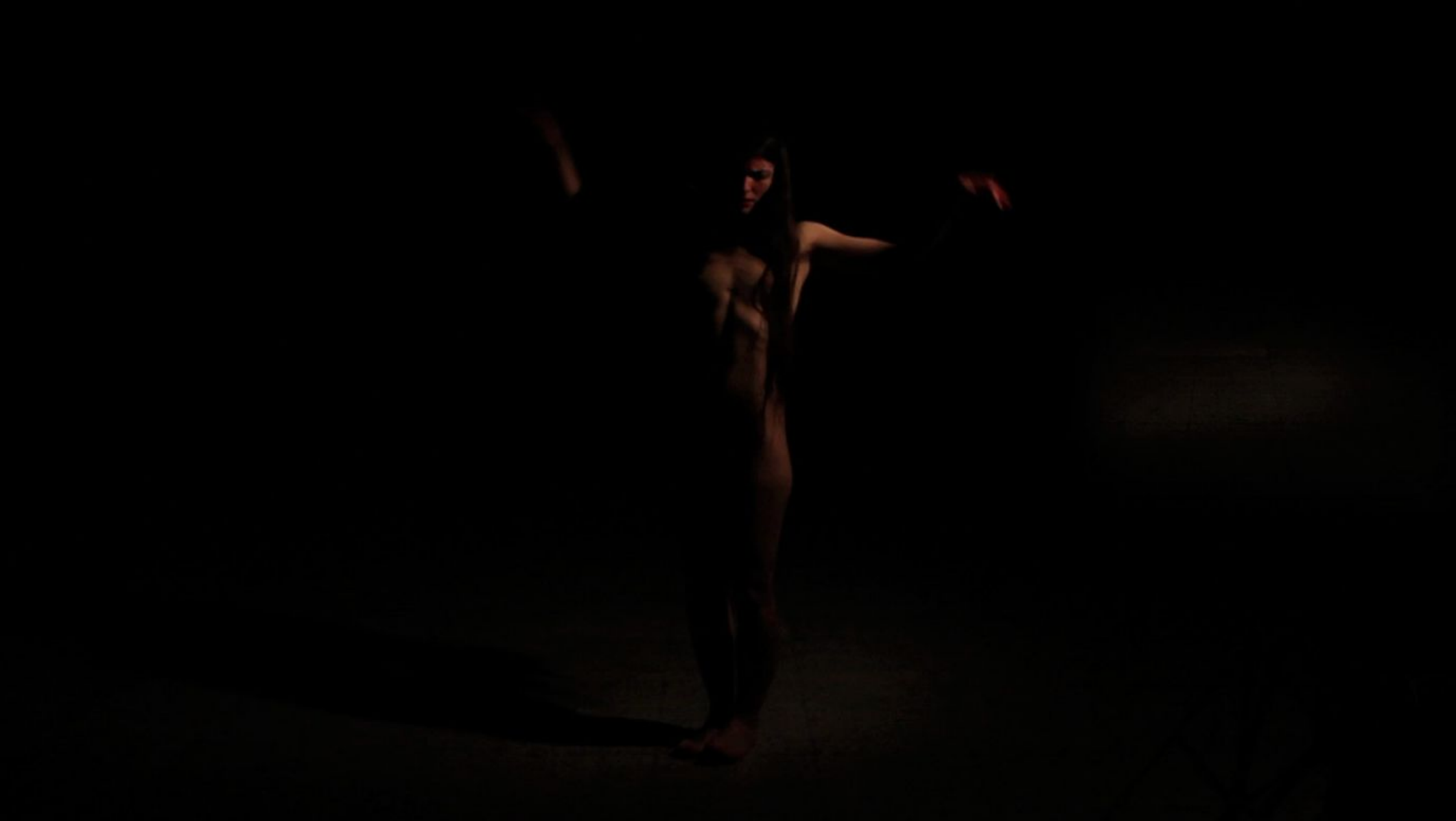
Entrenamiento Vídeo, 1'39'', 2014