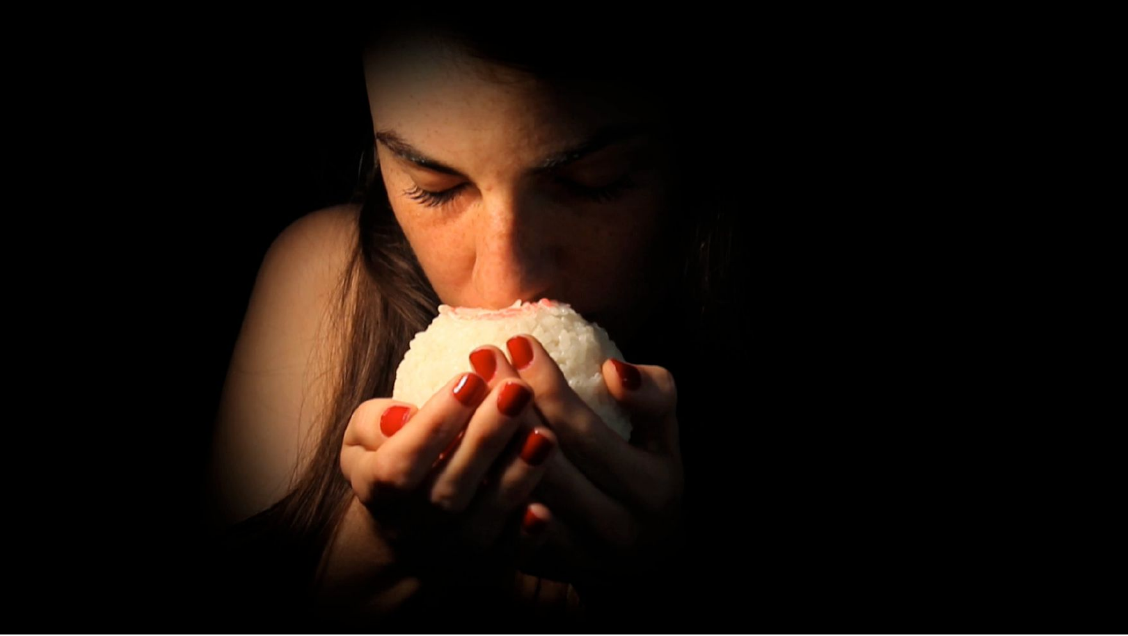
Lavar las bendiciones Vídeo, 2'50'', 2014