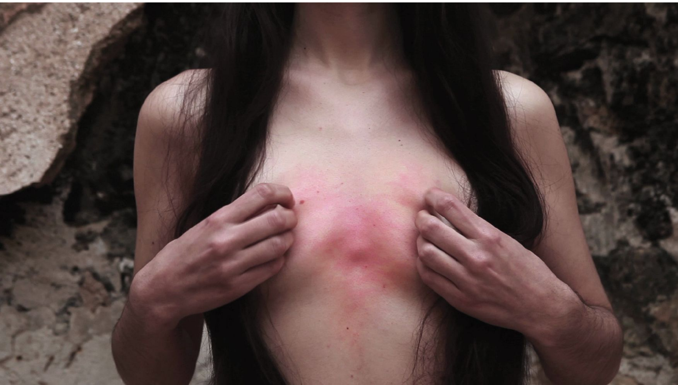
MissTaken touching heartself VÍdeo, 3'20'', 2013