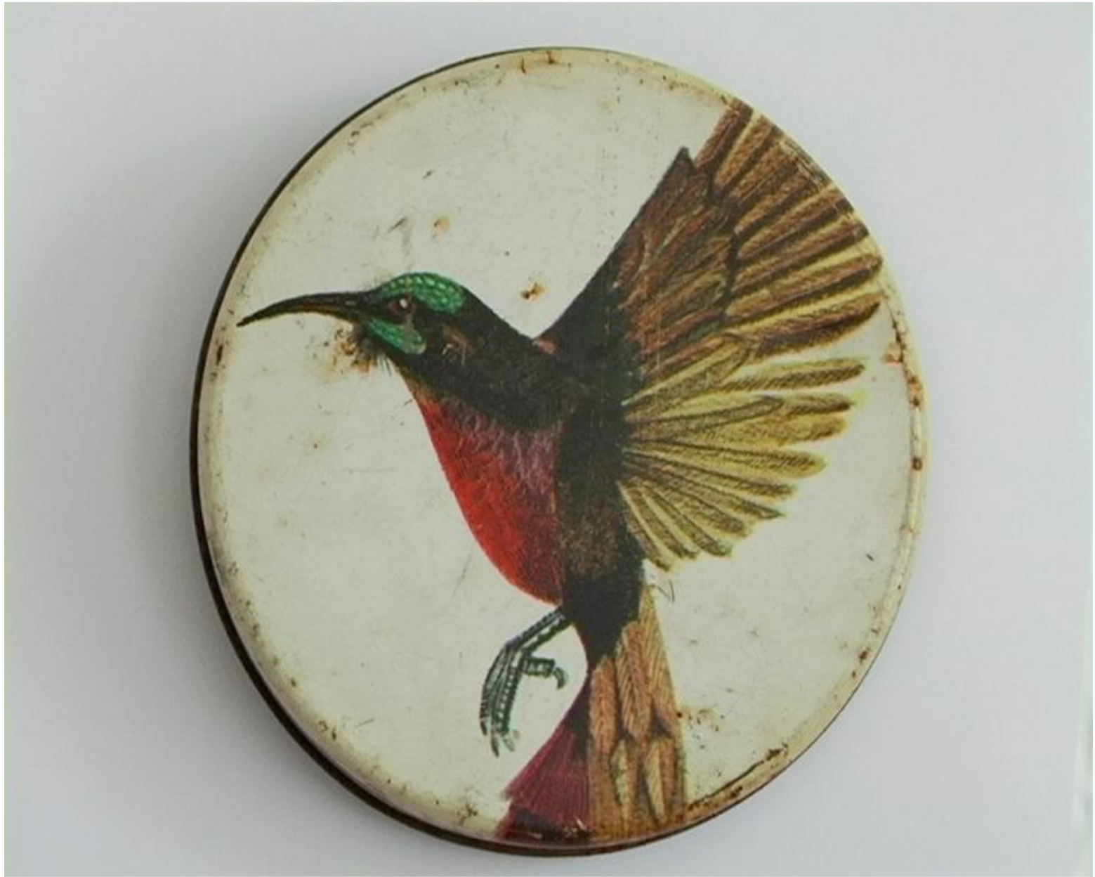
El hombre yace, el cielo se eleva, el aire mueve Vídeo, loop, 2014